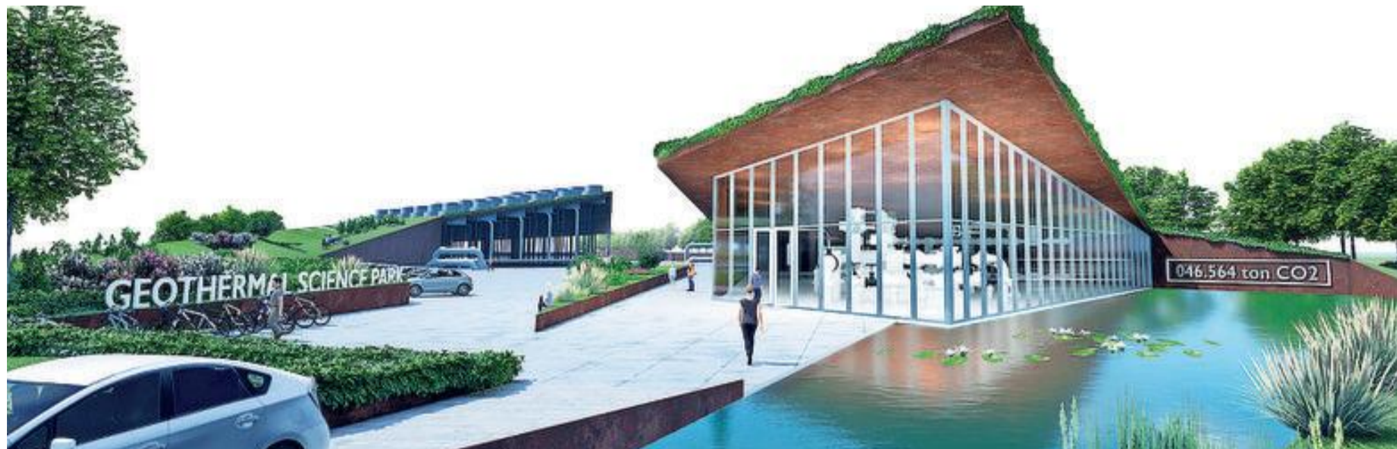
Zo zou een geothermische energiecentrale in Gooi en Eemland eruit kunnen gaan zien.